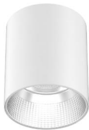
התמונה להמחשה בלבד!